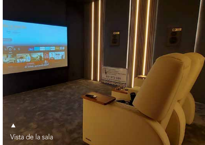
▲ Vista de la sala

o mejor vía aplicación dedicada (muy trabajada y entendible) con la que es posible tocar parámetros "al vuelo" y apreciar al instante sus efectos.