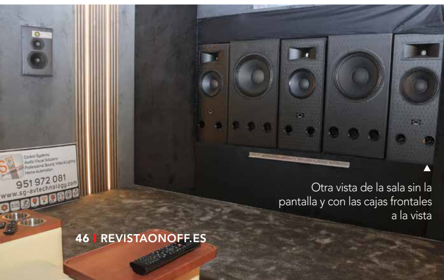
▲ Otra vista de la sala sin la pantalla y con las cajas frontales a la vista

El procesador Stormaudio y su sistema Dirac ART son un nuevo salto tecnológico notable en procesamiento acústico