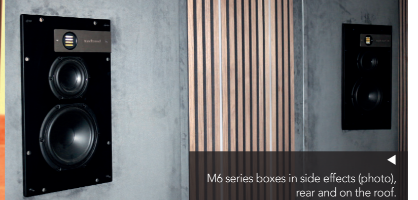
M6 series boxes in side effects (photo), rear and on the roof.