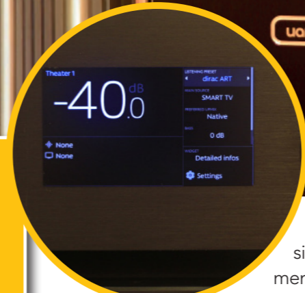
Rack with electronics (processor and stages).

P.V.P.: From 1,051 € (speakers) 14,459 € (Stormaudio processor) from 5,408 € (amplifiers)