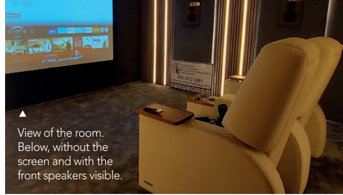
View of the room. Below, without the screen and with the front speakers visible.

decode any immersive sound format (Auro-3D, Dolby Atmos, DTS:X Pro, IMAX Enhanced) and apply Dirac correction in any type of configuration, up to four-way active boxes or any number of bass drawers. It can be controlled from its screen (in our case not visible, mounted on an external rack) or better via a dedicated application (very elaborate and understandable) with which it is possible to touch parameters "on the fly" and instantly appreciate its effects. The power stages used, the "muscle" that I mentioned above, were made up of three uandksound M4500D stages (4 channels of 750 watts in Class D each) and one uandksound M7300 (7 channels of 300 watts in class AB).